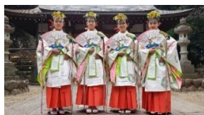
【三尻小6年の舞姫たち】

三尻小の北側の三ヶ尻八幡神社は鶴岡八幡宮の御分霊社であり、今でも毎年大イチョウのしめ縄を奉納しています。