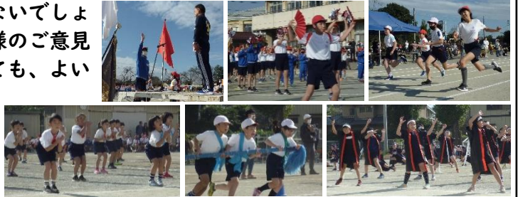
半日開催の運動会について

新型コロナのため、例年よりも少ない練習時間で臨んだ今年の運動会。半日での開催、参観者の制限など、皆様の期待に沿えないところもありましたが、「笑顔いっぱい、仲間を信じて、最後まで」のスローガンのもと、一人一人の児童が、自分の演技・競技、係の仕事、応援等、力いっぱいがんばりました。コロナ禍の運動会も思い出深いものになったのではないのでしょうか。半日の開催ではありましたが、保護者の皆様のご意見から、子供たちにとっても、保護者の皆様にとっても、よい運動会になったのではないかと、胸をなでおろしています。課題につきましては、来年度に向けての貴重な意見として参考にさせていただきます。ご理解・ご協力ありがとうございました。