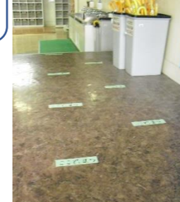
距離を確保するための表示