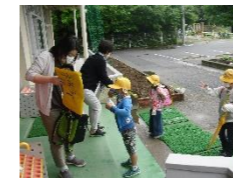
健康観察カードの確認

6月1日(月)分散登校ではありますが、いよいよ授業が始まりました。子供たちも待ちに待っていたことと思います。新型コロナウイルス感染症が完全に終息したわけではなく、ご心配されている保護者の方もいらっしゃると思いますが、学校として予防対策をしっかりとしながら、子供たちが安心して過ごせるよう全力を尽くしてまいります。今後ともご理解とご協力をお願いいたします。