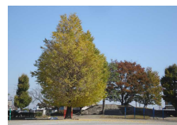
三尻小のイチョウ