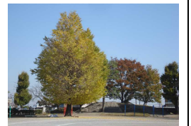
三尻小のイチョウ